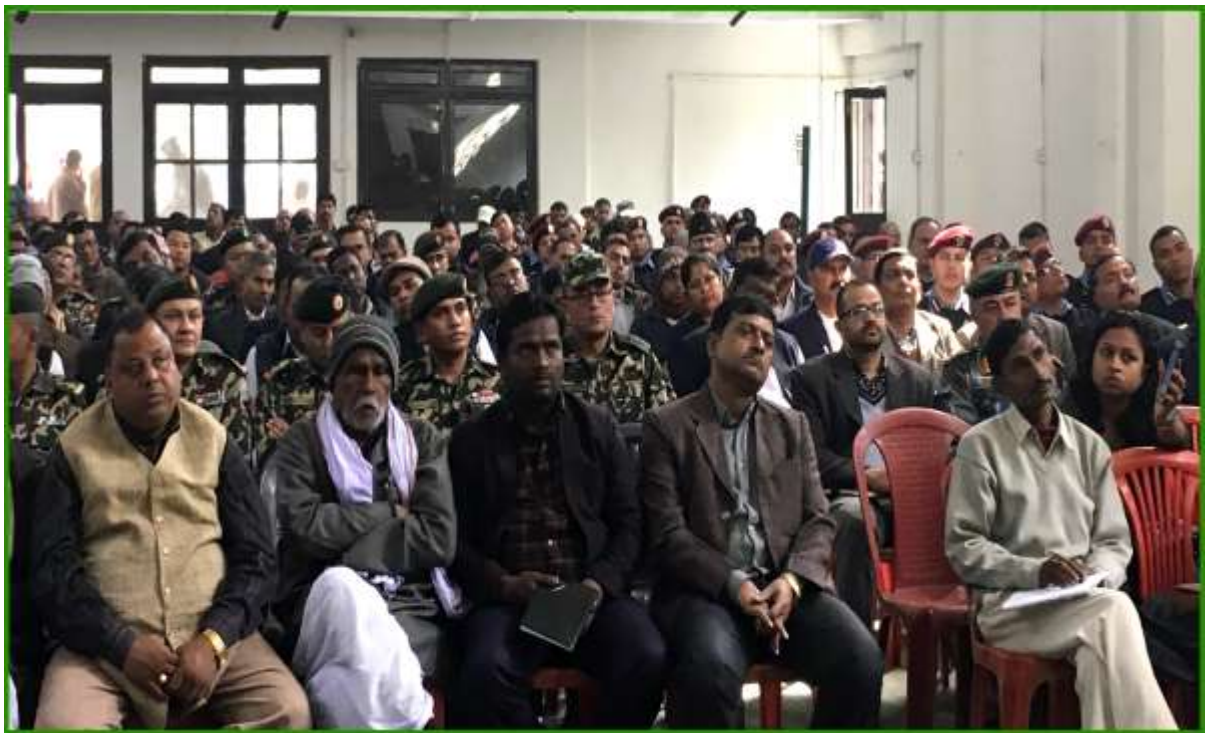
प्रदेश नं. २ जनकपुरमा आयोजित लेखापरीक्षण अन्तरक्रिया कार्यक्रममा सहभागी पदाधिकारीहरु