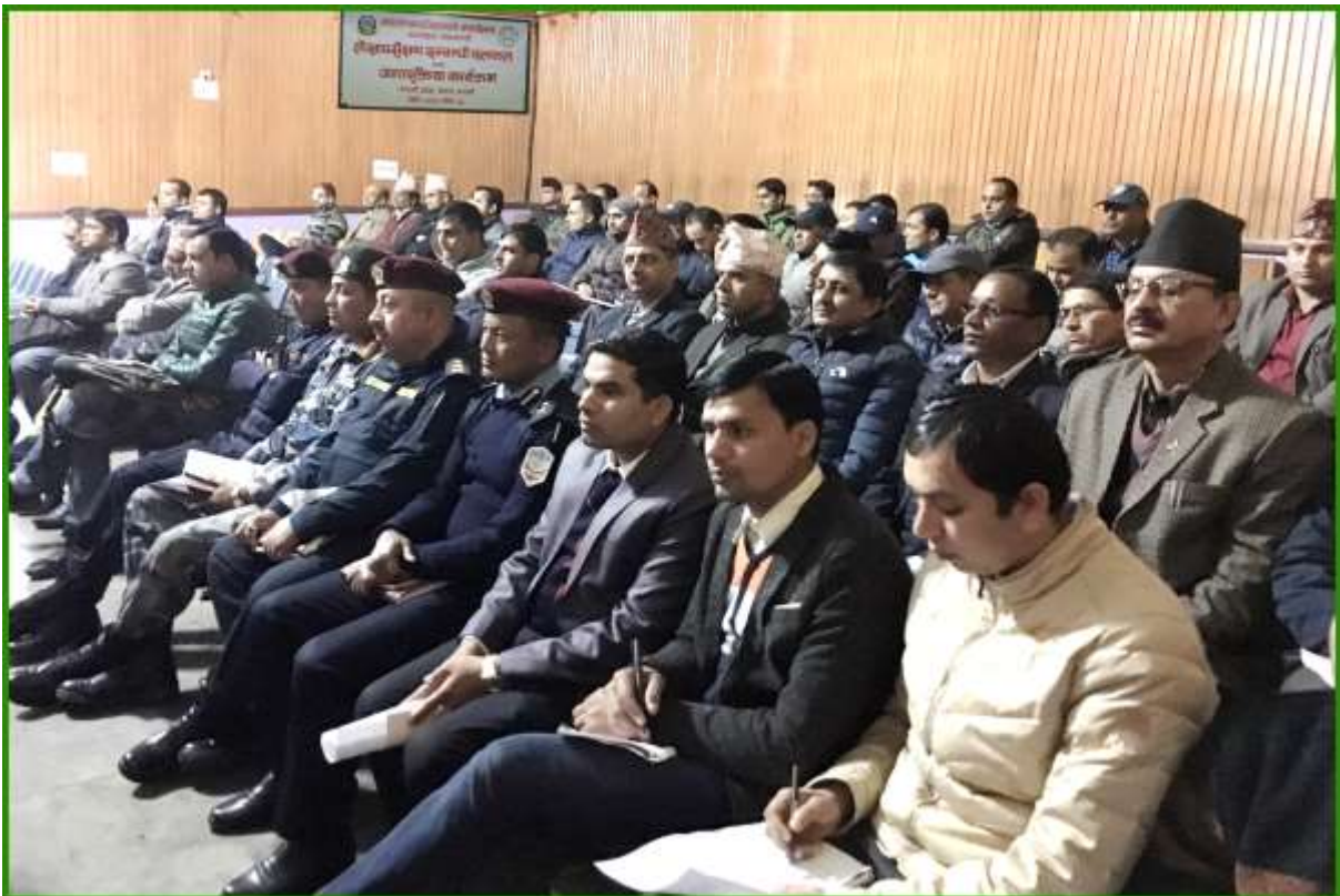
गण्डकी प्रदेशको पोखरामा आयोजित लेखापरीक्षण अन्तरक्रिया कार्यक्रममा सहभागी पदाधिकारीहरु